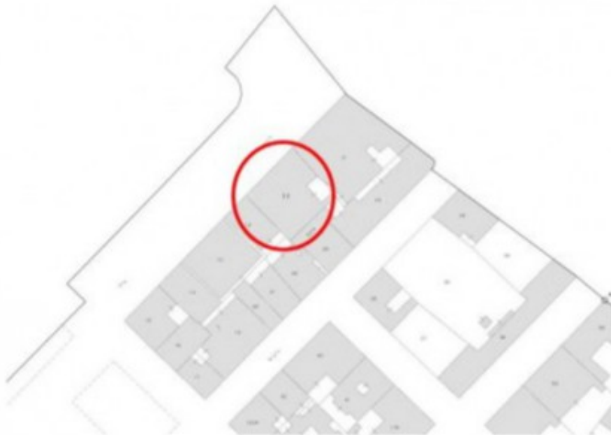
Estratto di mappa